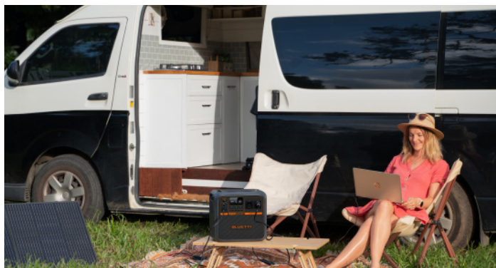
Поїздка на автофургоні